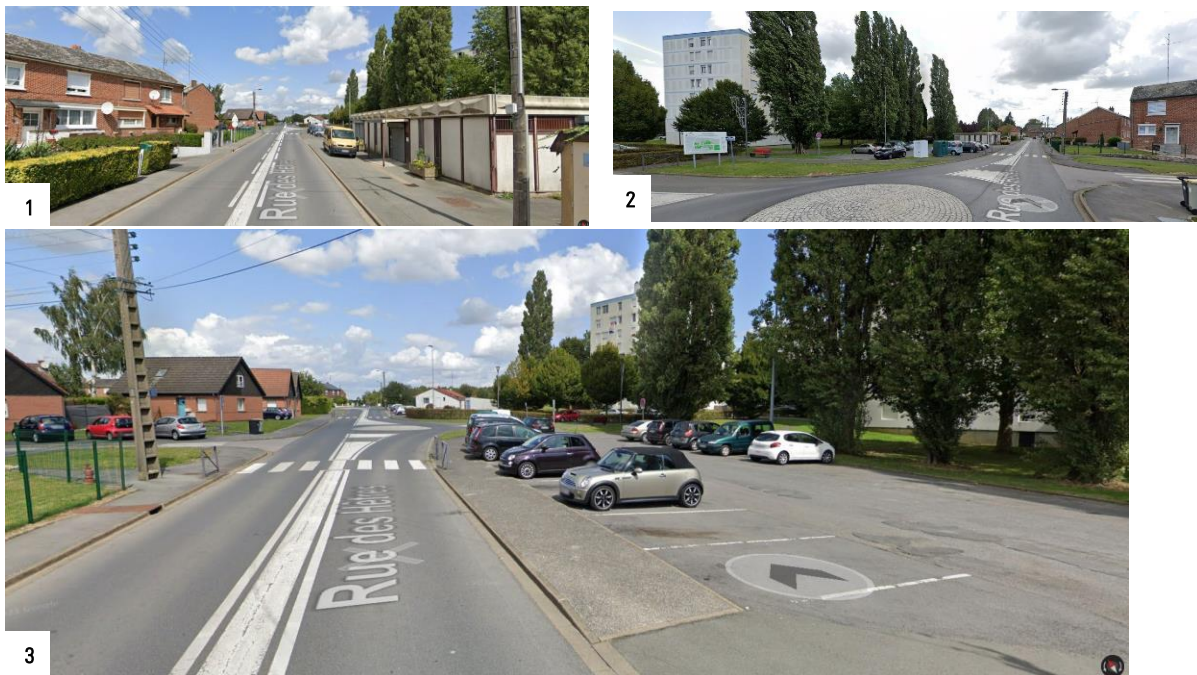
Vue in situ de l'actuelle salle des Hêtres (1), du parking attendant depuis l'avenue F. Mitterrand (2) et la rue des Hêtres (3)

La future Salle des Hêtres s'implantera sur le parking au nord de l'actuelle salle à l'angle de la Rue des Hêtres et de l'Avenue François Mitterrand : il s'agit de la parcelle cadastrale n° 0492.