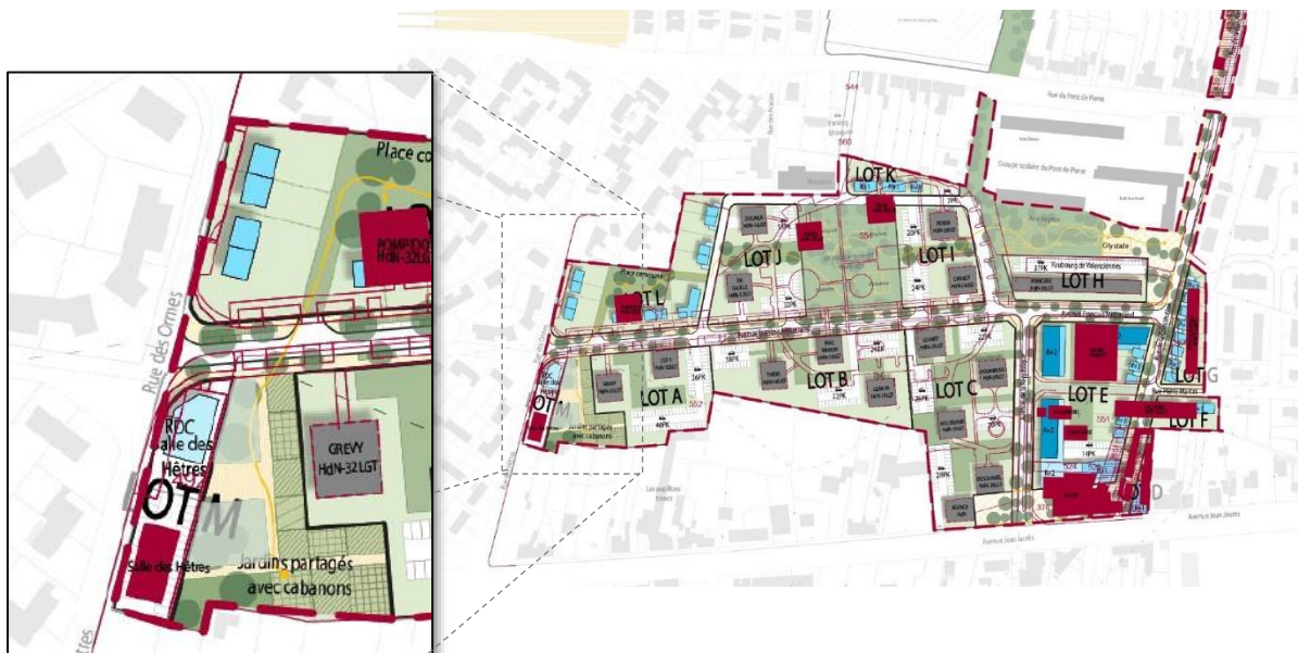
Plan guide du secteur des Présidents avec zoom sur la rue des Hêtres © Atelier 9.81, décembre 2019

Géré par le service « Relations publiques & protocole » et fermé fin 2020, l'actuel foyer des Hêtres proposait l'offre suivante : une salle d'une capacité de 80 personnes, une cuisine, un local de rangement sur une superficie d'environ 180 m 2 SDP. Au regard de son état bâtementaire et de son implantation, est alors apparue l'opportunité de porter et financer sa relocalisation dans le cadre du projet NPRU.